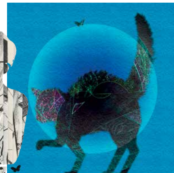
ritagli gatto nel cerchio