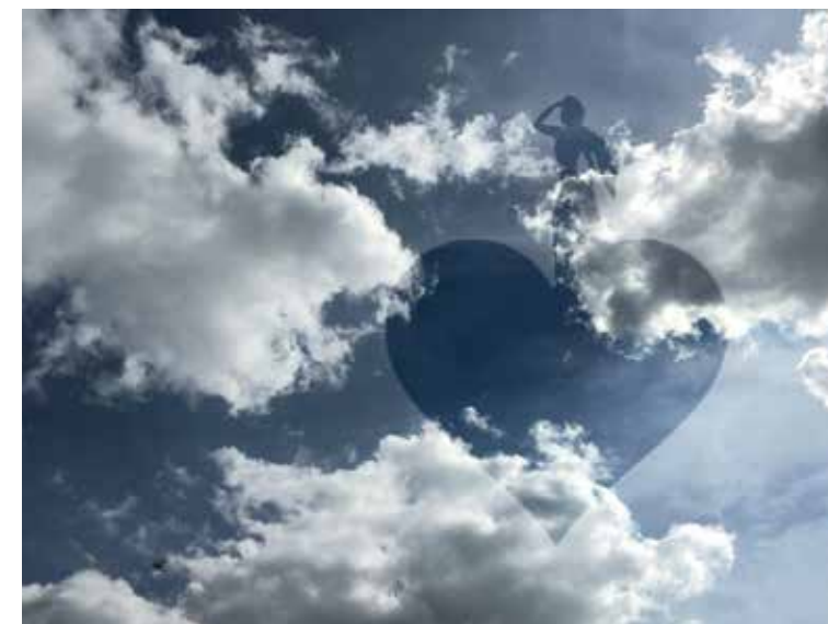
sail away. verso casa

En choisissant les animaux et les souvenirs comme muse, Lydia représente la liberté et propose de s'évader le temps d'une contemplation, sans pour autant sortir. Au travers des chevaux, du ciel et de plusieurs heures à les contempler, l'artiste plasticienne propose un voyage introspectif coloré et méditatif. Dans ce partage de douceur, l'artiste se lance dans un nouveau projet intitulé l'intercommunicabilité. Une création inspirée de la révolution urbaine au cours de laquelle les œuvres sont imprimées sur des tissus. Elles évoluent et prennent une forme inattendue pour vivre autrement.